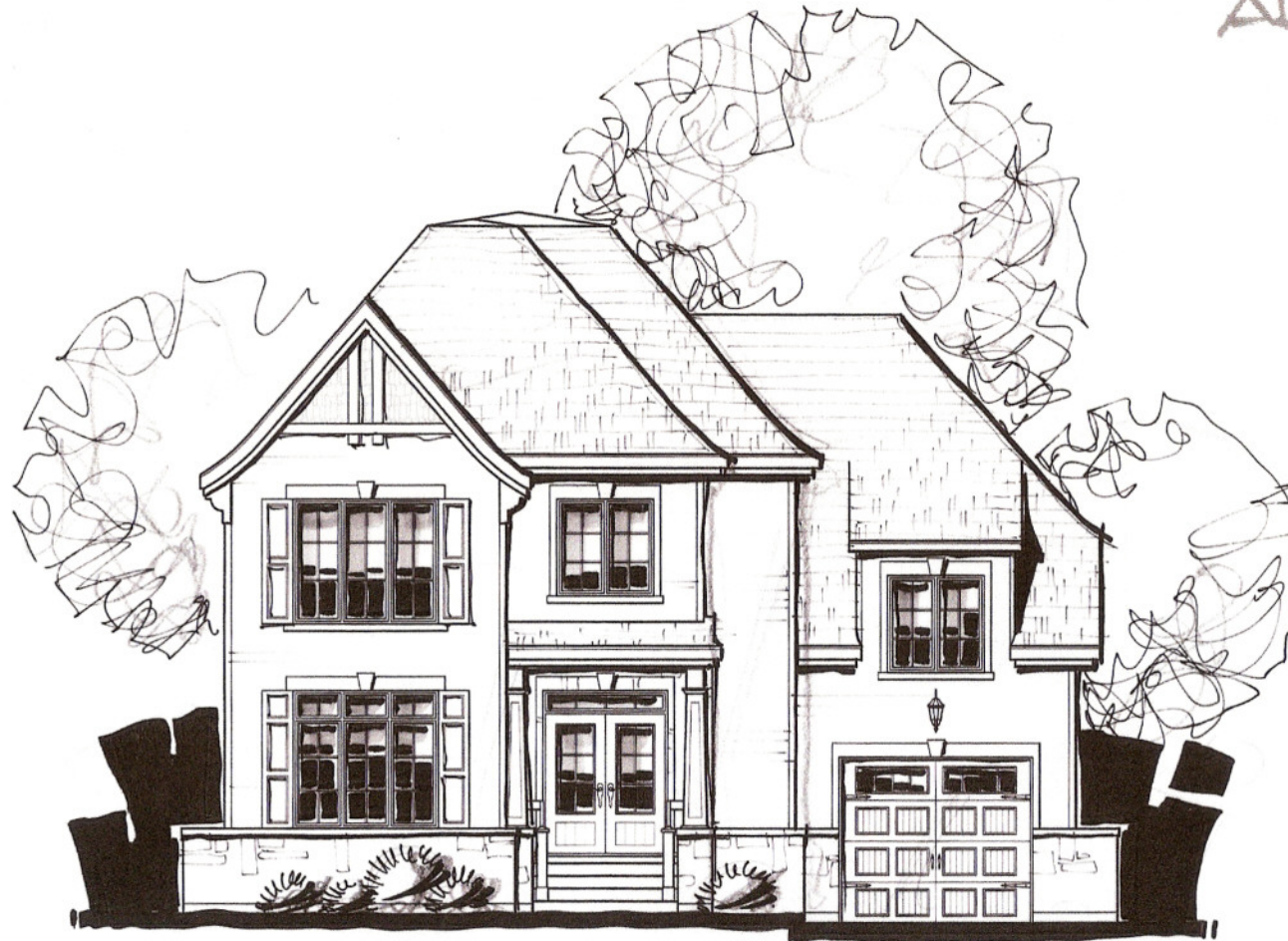
ESQ-12-743 MODÈLE "F" PROJET STE-CROIX